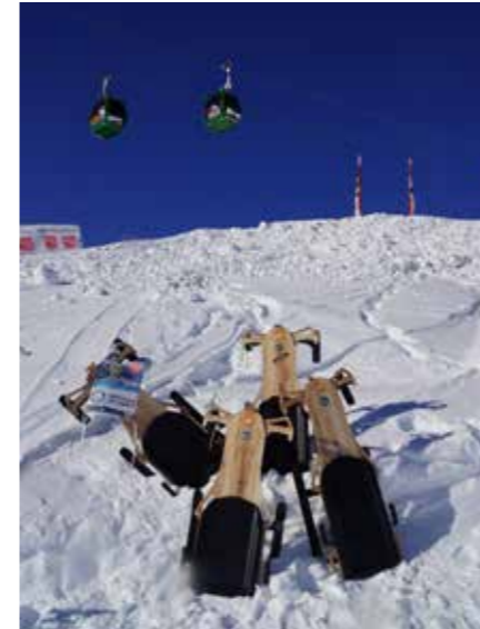
Mit dabei, der Pistenbock - die Rodel 2.0!