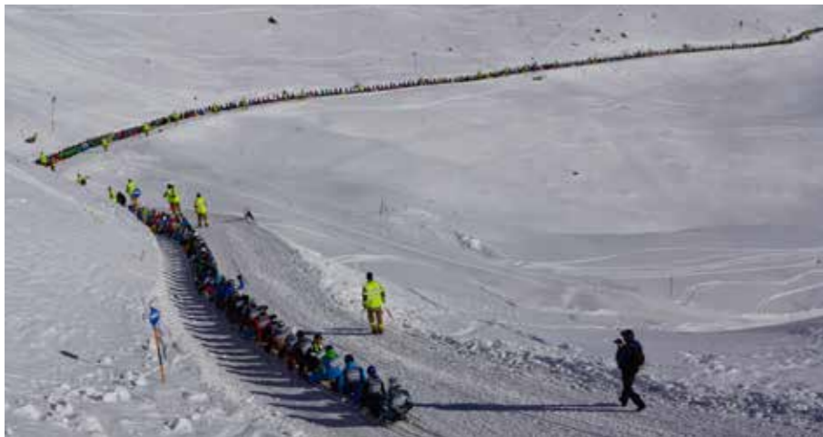
508 Rodler mit einer Gesamtlänge von 650 Metern machten sich auf den Weg zum Weltrekord.